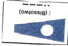
Flagge Startgruppe II